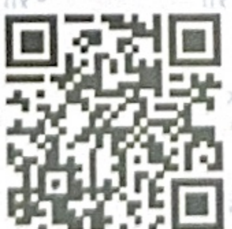
Verificación en línea / For online verification